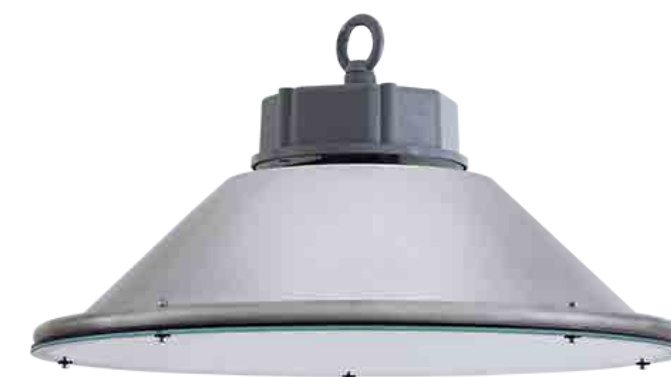
Luminaire High Bay 100 W 220-240 V CA

Ces deux projets traduisent une transition énergétique concrète et durable, alliant performance industrielle et responsabilité environnementale.